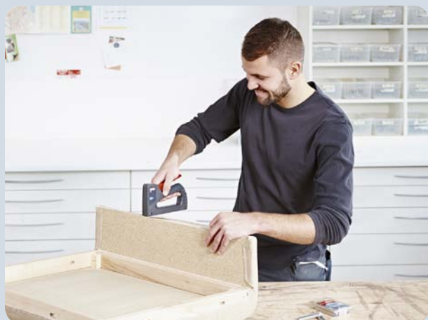
Fixation facile des tissus.

Mécanisme de chargement par bouton poussoir équipé d'un verrou pour un remplissage facile des agrafes en toute sécurité.